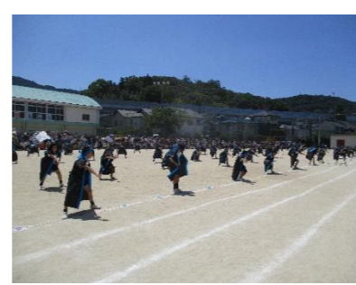
5年生 東小ソーラン 2024ver.