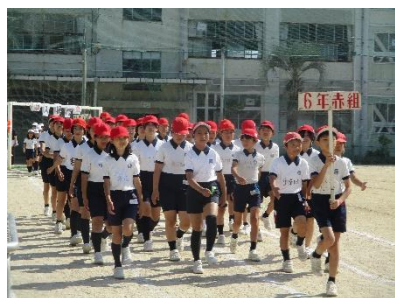
6年生 美しい入場行進

保護者の方々の温かいご声援やテント等の後方付けのご協力、心より感謝申し上げま す。ありがとうございました。