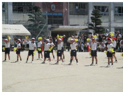
3年生 ノーリミット!パレード!