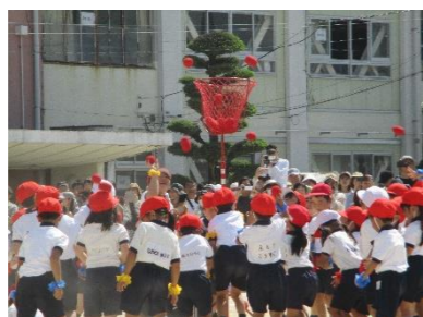
1年生 うみでおどって キラキラたまいれ