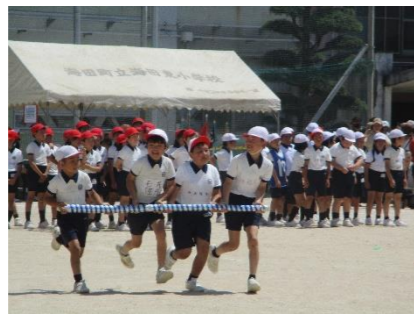
4年生 Harmony in color ～協力のうずを巻き起こせ～