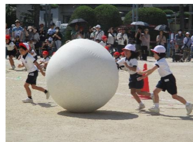
2年生 大玉ころりん ～障害物には気をつけろ!～